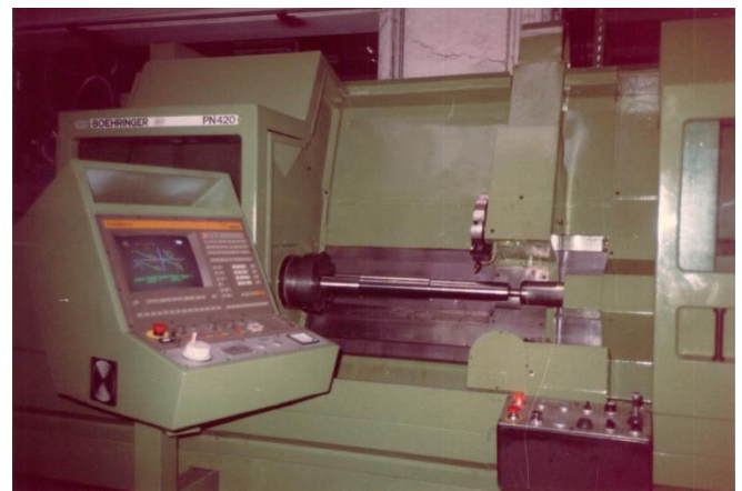
Bild 3: Mindestens 10 Böhrlinger baute die WIAP AG um. Daraus ergab sich eine starke Verbundenheit zwischen der Wiap und der Böhrlinger Konstruktion; resp. Maschinenbauart der Fa. Böhrlinger.