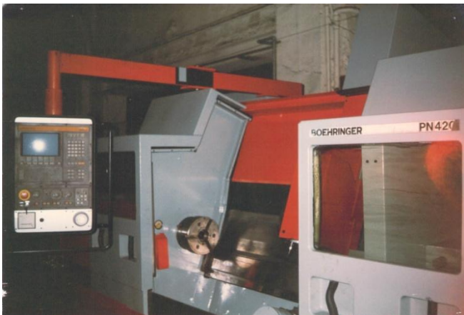
Bild 1: Böhrlinger PN 420 umgebaut mit einer neuen Sinumerik CNC Steuerung

Die WIAP AG hat mehrere Boehringer CNC Maschinen revidiert und umgebaut. Boehringer war eine Firma wie Georg Fischer, ein Marktführer in Europa. Boehringer, welche in früheren Jahren mit Turcyte Gleitbelägen gearbeitet hat und sich dieser an vielen Maschinen löste, musste weltweit eine beachtliche Menge Maschinen nachgebessert werden. Dies kostete dem renomierten Drehmaschinen Hersteller viel Kraft. Aber was sie bauten, egal welche Getriebe, oder was auch immer, Böhrlingen war ein beachtlicher, guter Maschinenbauer aus Deutschland. Wenn die Wiap AG eine 30 jährige Maschine umbaute, haben Kunden damit nochmals 20 bis 30 Jahre damit produziert.