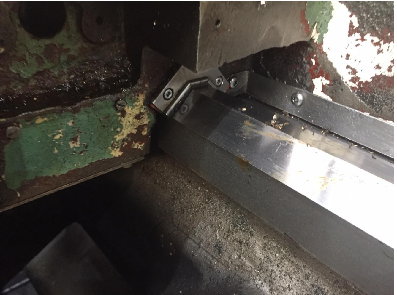
Bild 7. Sehr wichtig die Abstreifer immer gut pflegen, dass nie Schmutz unter die Gleitbeläge kommt.