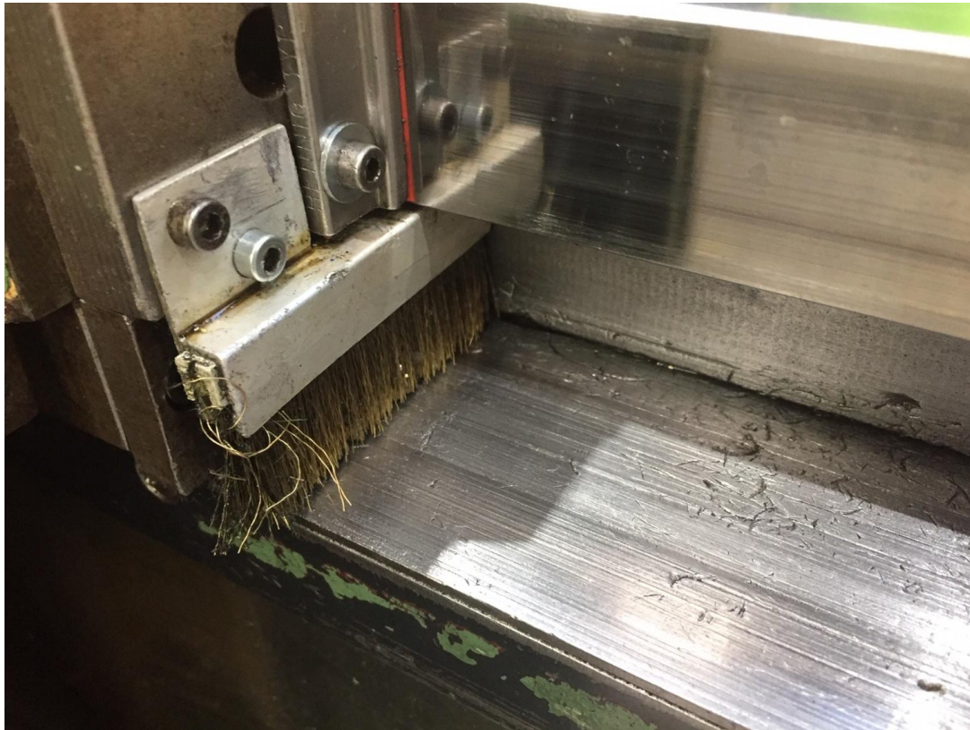
Bild 9; Zusätzlich zu den Abstreifern, Bürsten helfen die Lebensdauer zu verlängern der Abstreifer