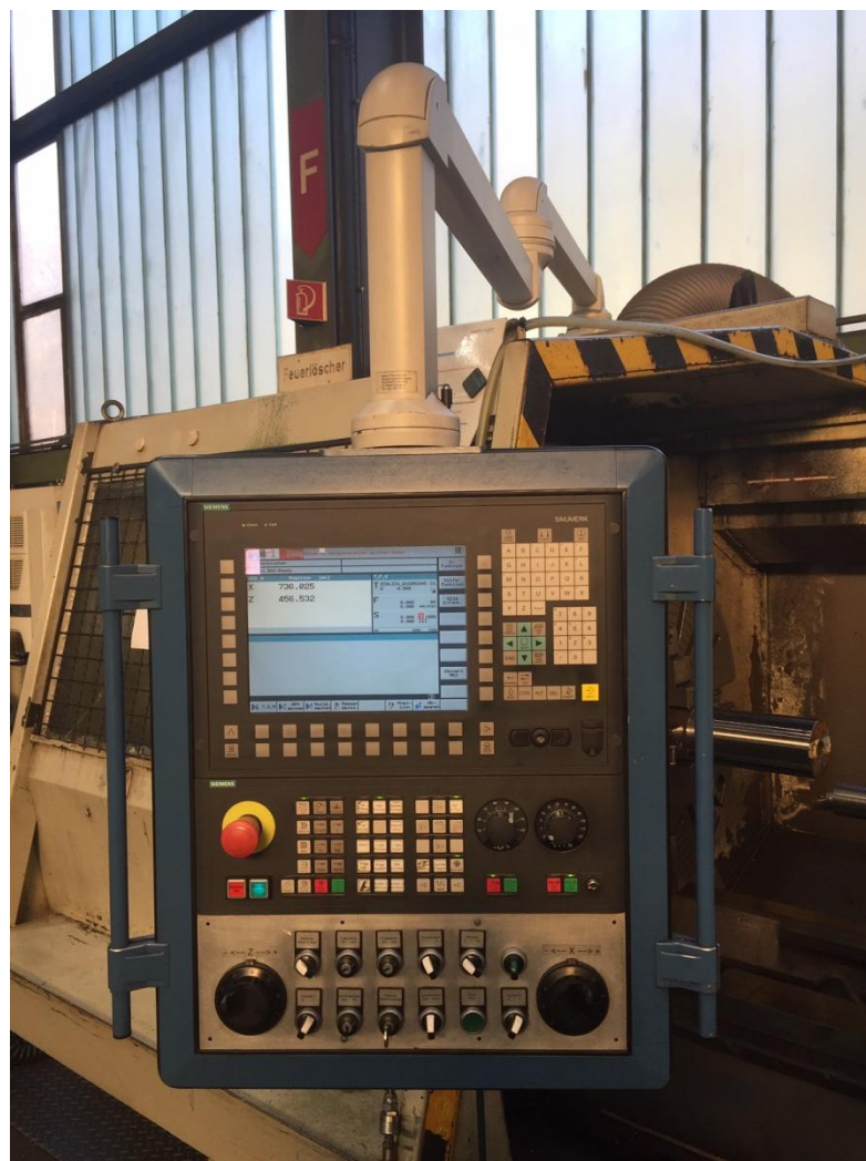
TITELBILD1: Umgebaute CNC Drehmaschine mit Sinumerik 840