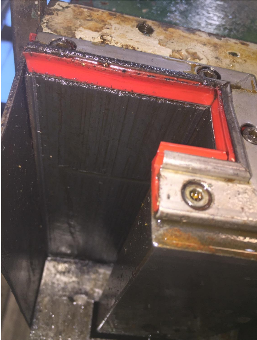
Bild 5. Weipert wählte hier ein eigener Weg bei der Führungsgestaltung sie fährt mit einem Langen X Schlitten mit dem Oberschlitten über die die Führungen hinaus. Das forderte an den Operateur drauf zu achten, dass die Führungen gelegentlich gereinigt und geprüft werden.