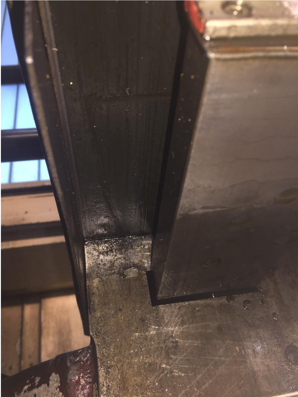
Bild 6: Der Gleitbelag ist ein SKC der wird aufgegossen ist nicht so einfach wie ein Turciten oder Wolf Belage K100 doch etwas aufwendiger wir machten das an einer 150 Tonnen Maschinen Revision auch, Link zu dem 150 Tonnen Projekt