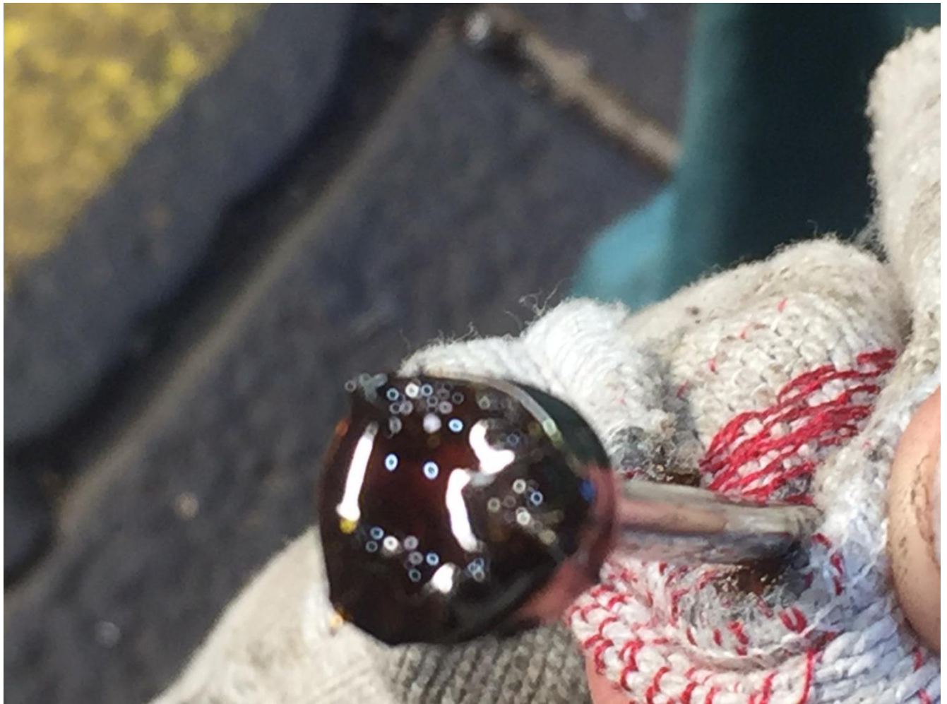
Bild 10: Bei regelmässiger Wartung können Fehler reduziert werden