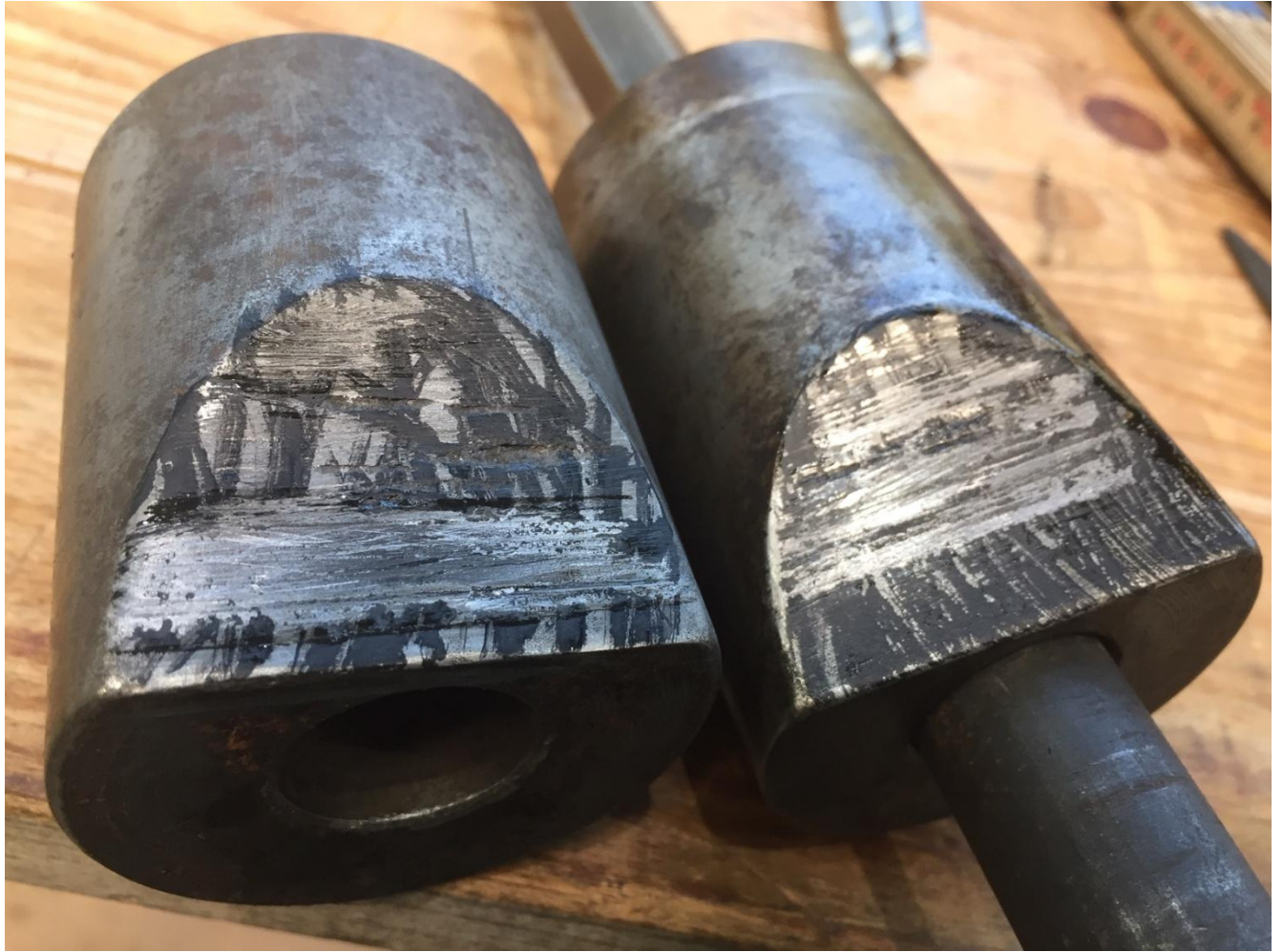
Bild 11. Die Reitstock Pinole hat angefressen bei der Klemmung. Die Zapfen sind aus Grauguss. Das sollte nicht passieren.