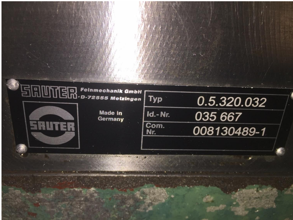
Bild 4. Ansicht Revolver Bezeichnung. Immer wichtig wenn Ersatzteile beschafft werden müssen