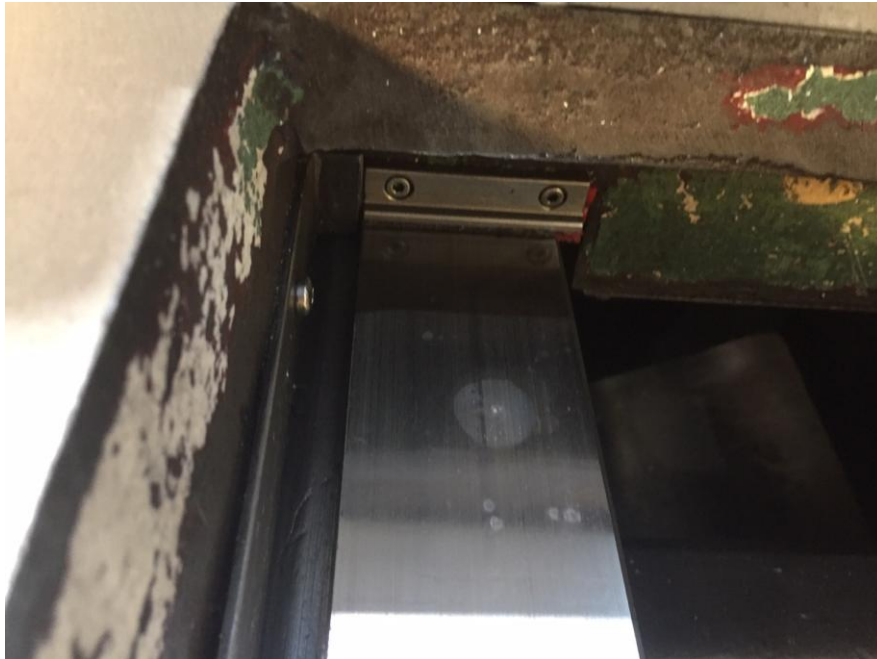
Bild 8: In der Regel sind die Z und Reitsock Führungen bei Flachbett Maschinen immer getrennt