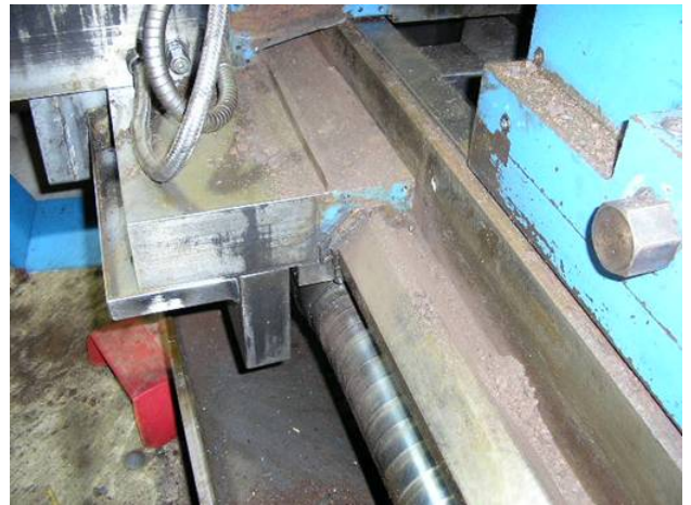
Photo: Hier verdrachte Carlo noch neu, nachdem man sah, wie die Klemmen vom Wasser litten.