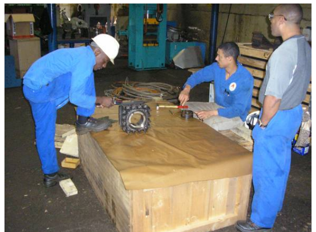
Photo: Der Zusammenbau.