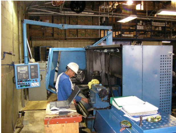
Photo: Die Maschine lieferten wir von einem CH Kunden nach Angola.