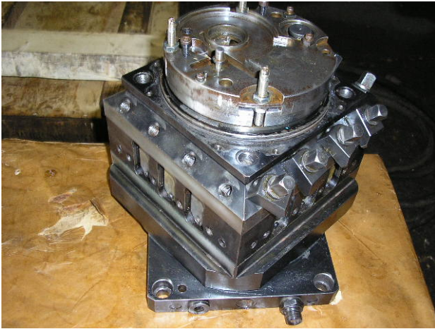
Photo: Bald fertig montierter Revolver, alles von Hand getestet, er verriegelt schön. Tipp top.