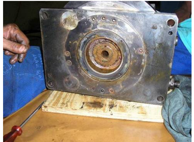
Photo: Beim Abschrauben des Revolvers die ersten Rostvorankündigungen.