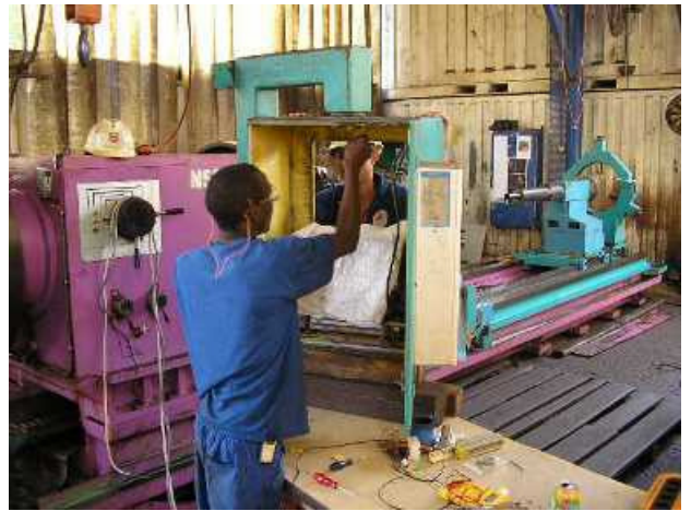
P8: Nun beginnt man mit dem Umbau der CNC.