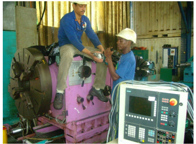
P12: Getriebe Umbau für den Schalteranbau, damit das Getriebe nicht mehr falsch geschaltet werden kann. Vor allem, ohne Getriebestufe keine Drehzahl.