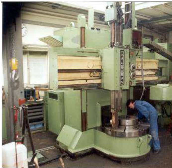
Bild 1: Das Berthiez Karussell, Frankreich, wurde komplett mit neuen Vorschub Motoren, neuem Spindelmotor und einer neuen CNC Steuerung Sinumerik ausgerüstet.