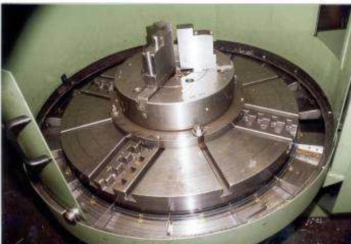
Bild 5: Ein Ringsystem hat die anfallenden Späne, welche durch die Zentrifugal Kraft nach aussen fallen, eingesammelt und durch ein Loch in einen Späneförderer bewegt.

Die Wiap AG baut eigene Werkzeugmaschinen und hat einen Zulieferanten Stamm. Ob bei Neumaschinen oder Umbauten; es werden in der Regel überall dieselben Einbauteile verwendet. Somit ist auch die Ersatzteilgewährleistung gesichert.