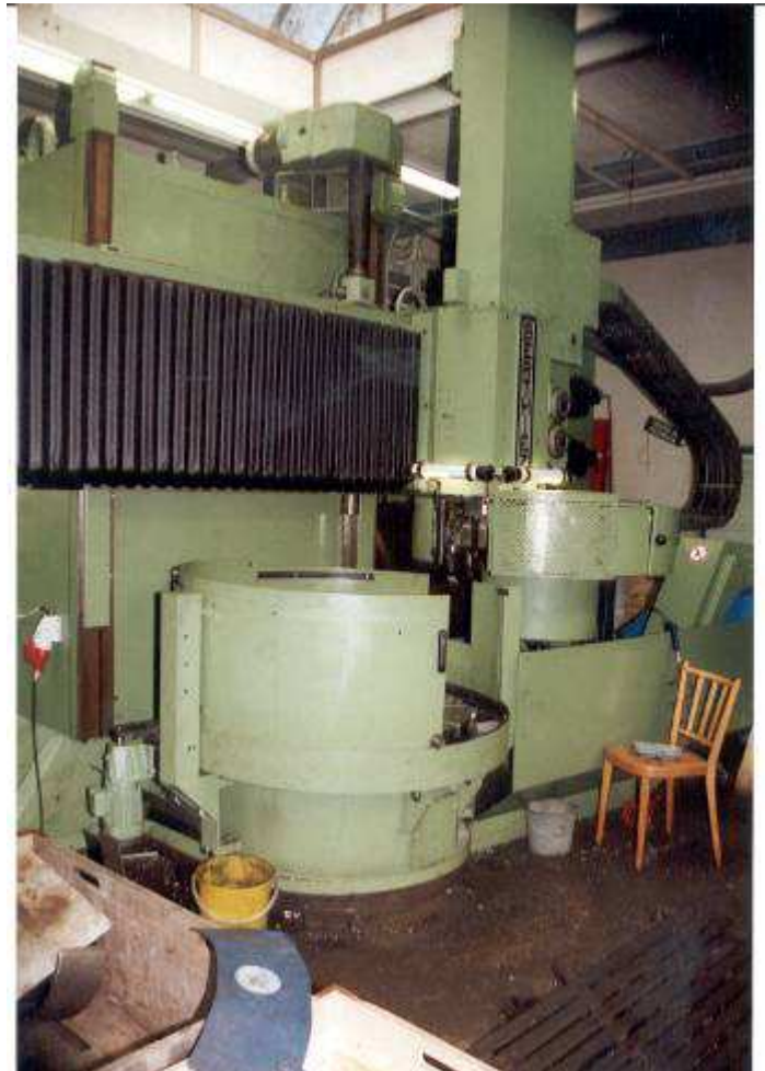
Bild 2: Die Maschine ist in einem guten Zustand. Wurde von einer grossen Schweizer LKW Firma übernommen in eine Schweizer Giesserei. Schwere Zerspanung war angesagt für diese Maschine.