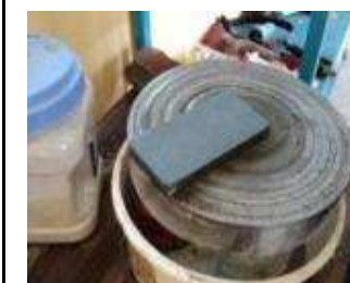
Danach den Stein gut waschen