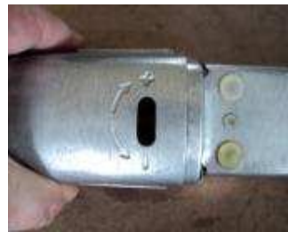
Hub Längen Einstellung 0- 20 mm