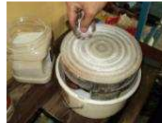
Abziehstein Reiniger mit Quarzsand bestreuen