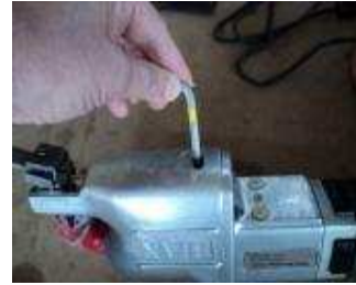
Mit dem 6 mm Inbus Hub einstellen