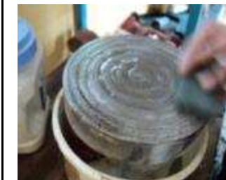
Dann mit dem Stein grosse Kreisbewegungen machen