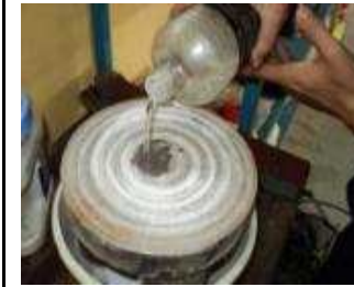
ca. 0,05 l Petrol auf den Abziehstein geben