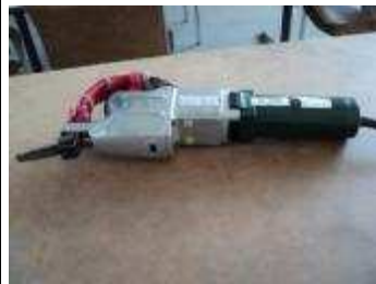
Schabmaschine 10 Punkte pro /Zoll