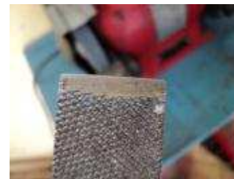
Entendimento correto fiele